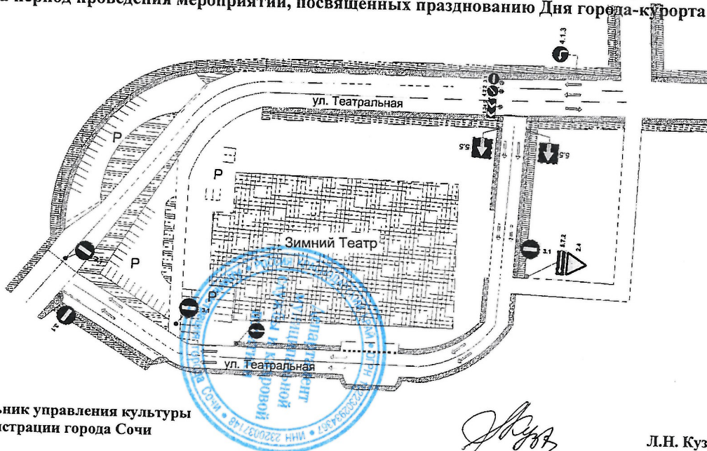
СХЕМА временной организации дорожного движения по ул. Театральная Центрального внутригородского района города Сочи на период проведения мероприятий, посвящённых празднованию Дня города-курорта Сочи

Начальник управления культуры администрации города Сочи